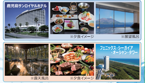
※夕食イメージ ※展望風呂 ※露天風呂 ※夕食イメージ

申込方法 7月9日(木) 8:30から電話/FAXで事務局へ ※8/10以降、キャンセル料が発生いたしますのでご注意ください。