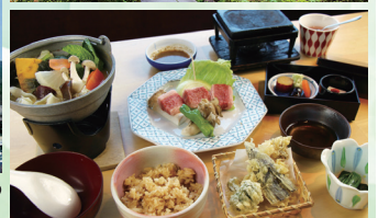
※浅間茶屋外観と料理イメージ(ご飯は白飯の予定)

行程 立川=御坂農園グレープハウス=浅間茶屋=北口本宮富士浅間神社=道の駅なるさわ=白糸ノ滝=立川(18:20着予定) 詳細は、後日参加者にご案内いたします。(8月上旬頃) 企画・実施: 株式会社 縁トラベル (東京都知事登録旅行業 第2-7639号)