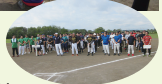
※写真: 前年度大会より