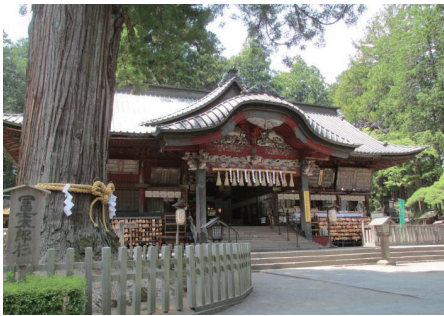
※北口本宮富士浅間神社