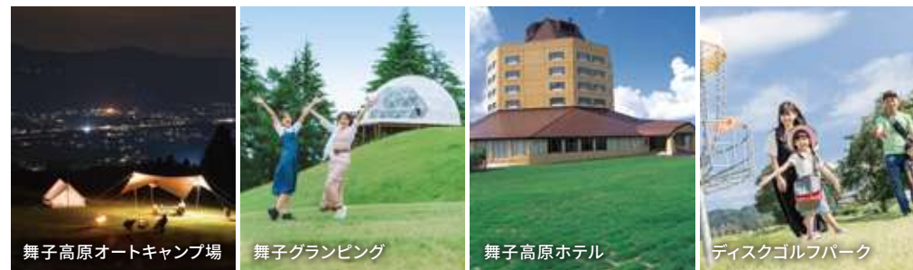
舞子高原オートキャンプ場