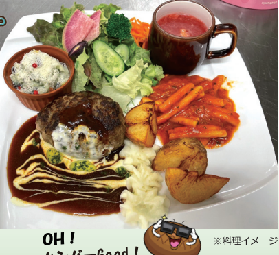
OH! ハンバーGood! ※料理イメージ

行程 立川=いちごの里=道の駅しもつけ=二荒山神社=レストランペニーレイン宇都宮店/ペニーレイン宿郷店=立川（18:30着予定） 詳細は、後日参加者にご案内いたします。 旅行企画・実施：株式会社 緑トラベル（東京都知事登録旅行業 第2-7639号）