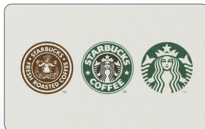
※カードイメージ。カードの種類は、お選びいただけません。