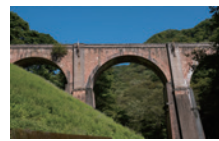
※碓氷第三橋梁（めがね橋）