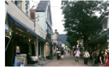
※旧軽井沢銀座通り