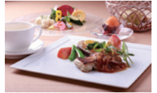
※軽井沢ロンギングハウス昼食イメージ

日程 6月16日（日）～17日（月） 添乗員同行 募集人数 20名 先着順 ※定数になり次第、締め切らせていただきます。 出発 立川市憩いの場前（北口）6:00頃予定 旅行代金