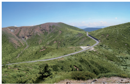
※志賀草津高原ルート