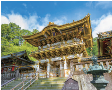
※日光東照宮 / 陽明門