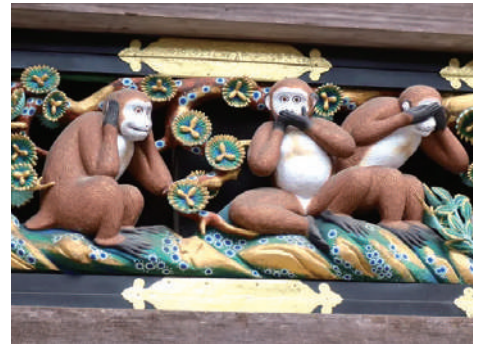
※三猿 / 神輿舎

日程 2月18日（日） 募集人数 60名 先着順 ※定数になり次第、締め切らせていただきます。 添乗員同行 出発 立川市憩いの場北側（北口） 7:05 立川市市民会館前（南口） 7:15 旅行代金 大人（会員／同居の家族） 9,900円 小人 8,900円 一般 14,000円 ※未就学児は参加不可。