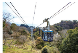
※日本平ロープウェイ