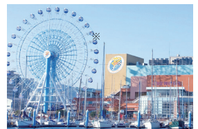
※エスパルスドリームプラザ