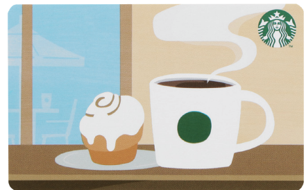
※カードイメージ。カードの種類は、お選びいただけません。