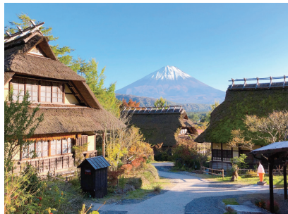
※西湖いやしの里根場