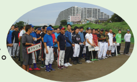
※写真:過去の大会より