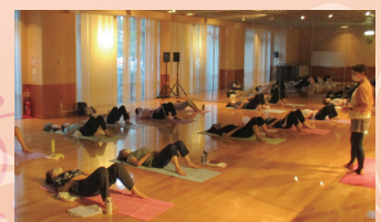
※写真：過去の講座より