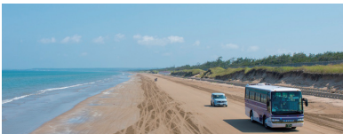
※千里浜なぎさドライブウェイ

1日目：自然が創り出した造形美や日本の原風景の息吹を感じてください！ 2日目：凜として荘厳、禅の道場「永平寺」と断崖絶壁・奇岩「東尋坊」！ 3日目：歴史と伝統に色づく街古都金沢の観光の王道スポットを堪能！